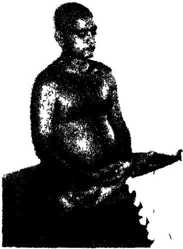
परम पूज्य आचार्यश्री 108 विद्यासागर जी महाराज